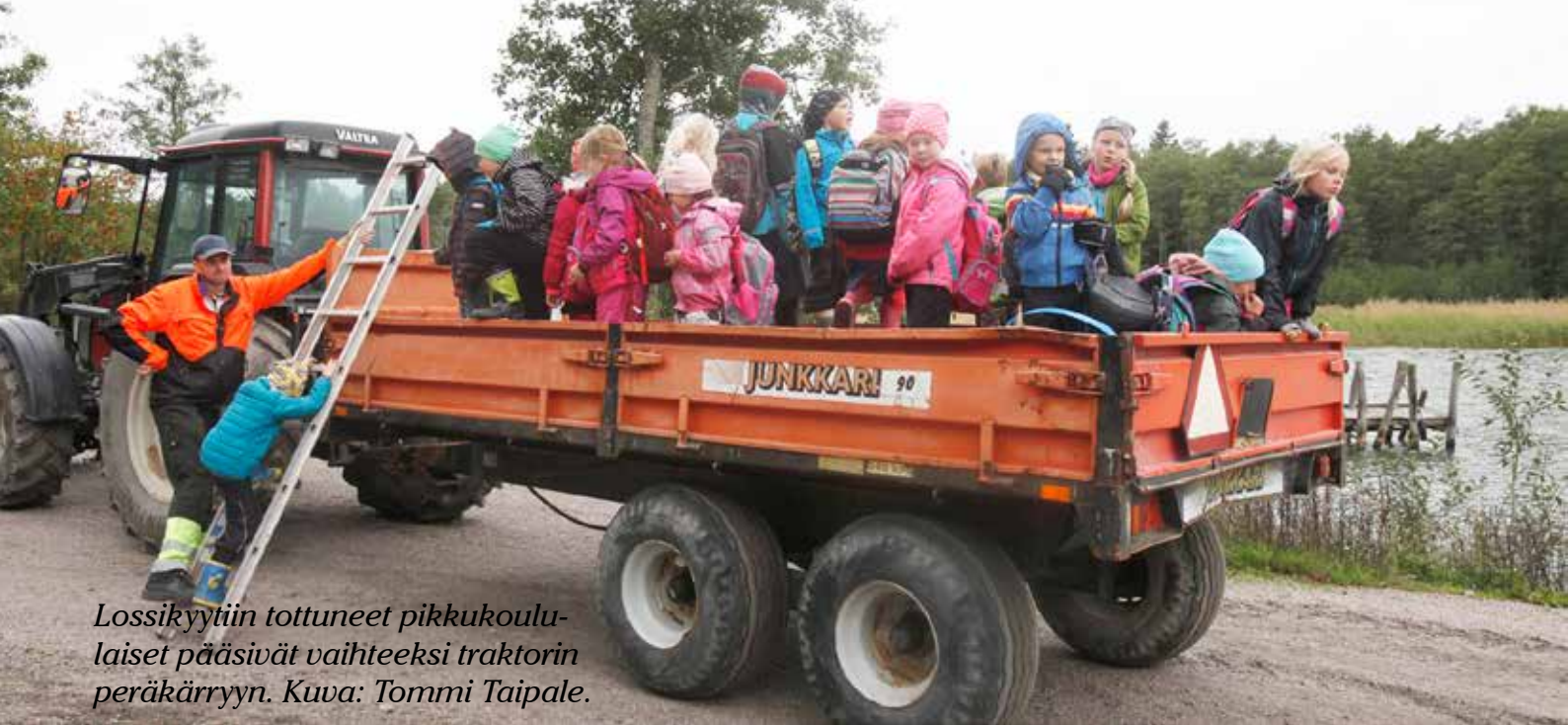
Lossikyitin tottuneet pikkukoulu- laiset pääsivät vaihteeksi traktorin peräkärriin.

Pro Sinervo ry:n Saaristotalohanke oli mukana suunnittelemassa ja toteuttamassa koulun teemaviikkoa. Suuri kiitos kaikille paikkakuntalaisille jotka osallistuivat viikon toteuttamiseen!