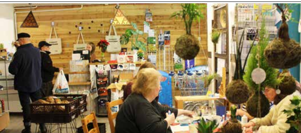
Livonsaaren Osuuskaupassa ostosten teko, kahvittelu ja kuulumisten vaihto sujuvat kätevästi samassa tilassa.

– Itse rauhoitun parhaiten niin, että menen navettaan, vaihdan eläimille puhtaat oljet ja istun kuuntelemaan, kun vuohet rouskuttavat kuivattua heinää. Toisessa kainalossani on lypsykuttu, toisessa tyytyväisenä tuhiseva koira ja sen kainalossa kehräävä kissa. Sitä tunnelmaa yritämme tuoda ripauksen kaupallekin.